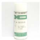
エアゾールタイプ A-9050