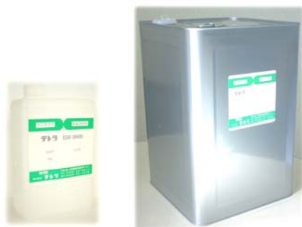
1 kg 角ポリ入